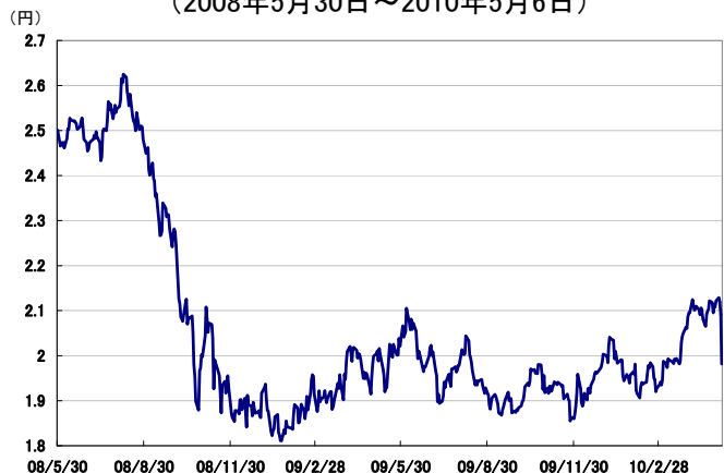
為替レート(インドルピー/円、グリニッジ標準時17時)の推移 (2008年5月30日～2010年5月6日)