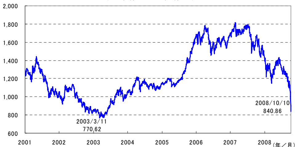
TOPIXの推移 (2001年1月4日～2008年10月10日)

※TOPIX(東証株価指数)は、東京証券取引所が算出・公表しています。また、同指数の標章、数値及びそこに含まれるデータに対する知的財産権その他一切の権利は東京証券取引所に帰属します。