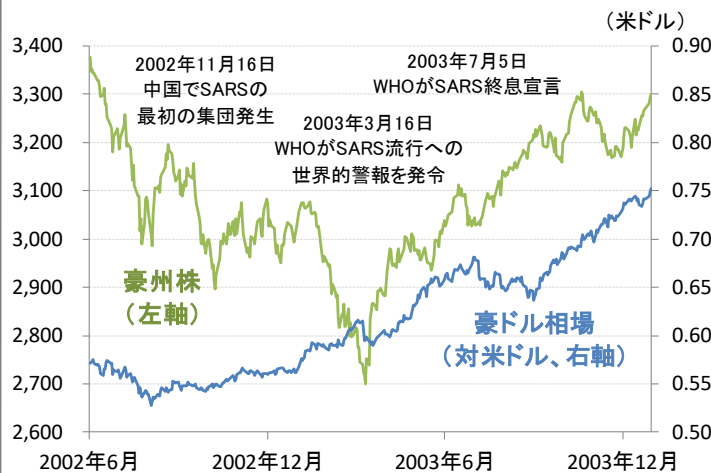
図2: SARS発生前後の豪州株と豪ドル相場の推移

(期間) 新型コロナウイルス: 2020年1月20日~2月2日 SARS: 2003年3月17日~6月26日 (注) SARSは重症急性呼吸器症候群の略。