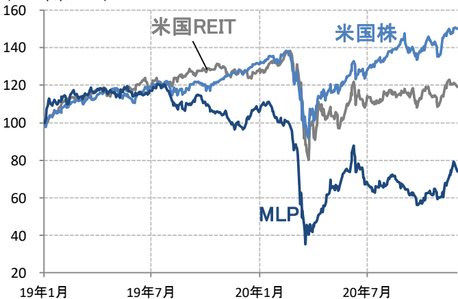
MLP・米国株・米国REITの配当利回りと長期金利