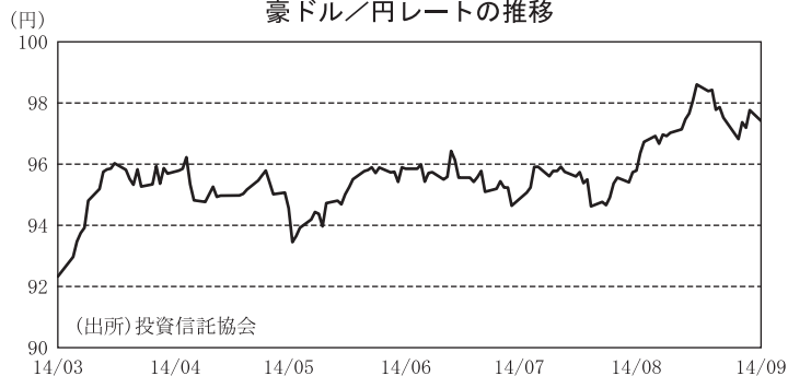
豪ドル／円レートの推移

■ 期の半ばは、中国の製造業PMI速報値が市場の予想を上回ったことなどから、豪ドル買い・円売りが優勢と