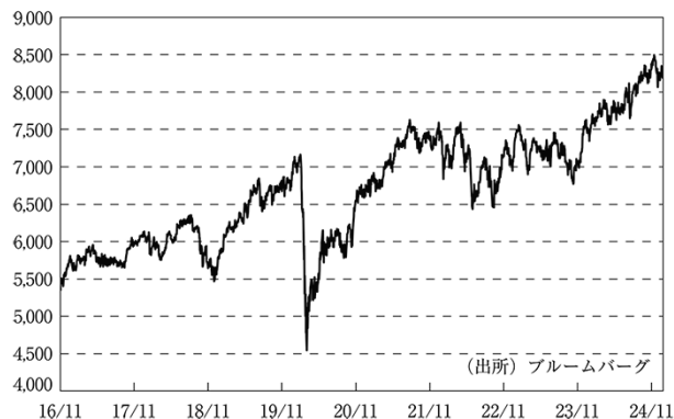
オーストラリア株式指数（S&amp;P/ASX200）の推移

信託期間の後半は、RBAが利上げを継続したことから、株式市場は上値の重い展開となりました。しかし、その後はRBAが今までの利上げ効果を見極める姿勢を示したため、追加利上げ観測が後退したことや、堅調な米国の経済指標や企業決算、人工知能（AI）への期待等から米国株式市場が上昇したため、オーストラリアの株式市場は上昇しました。