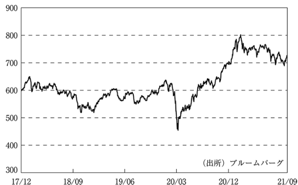
MSCI AC Asia Pacific ex Japan Index (現地通貨ベース) の推移

為替市場では、ニュージーランドドルが対円で上昇する一方、インドルピーが下落しました。