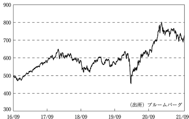
MSCI AC Asia Pacific ex Japan Index（現地通貨ベース）の推移

為替市場では、アジア・オセアニア通貨は対円で概ね上昇し、特にタイバーツ、シンガポールドルなどが大きく上昇しました。