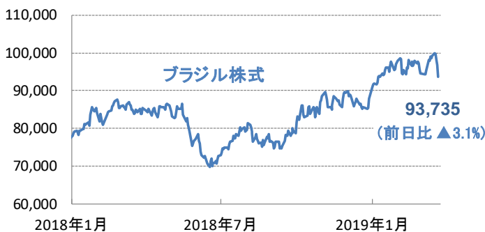
図1: ブラジル株式とレアル相場(対円)の動向

※基準価額算出に用いられる株式価格は、前日の海外市場の終値が適用されます。上記海外市場の株価指数において日本の営業日に応答する海外市場が休日の場合、その前日の指数を提示しています。為替は当日のレートが適用されます。