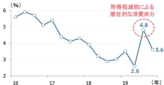
図3: 豪州の家計貯蓄率の推移

(注) 家計貯蓄率は貯蓄額を可処分所得で割った比率。(期間) 2016年1Q~2019年4Q