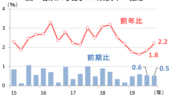
図1: 豪州の実質GDP成長率の推移

2020年1-3月期のGDPは急減速する公算が高まっているものの、豪州政府・中銀の協調的な景気刺激策によって景気底割れが回避されるかに注目が集まりそうです。