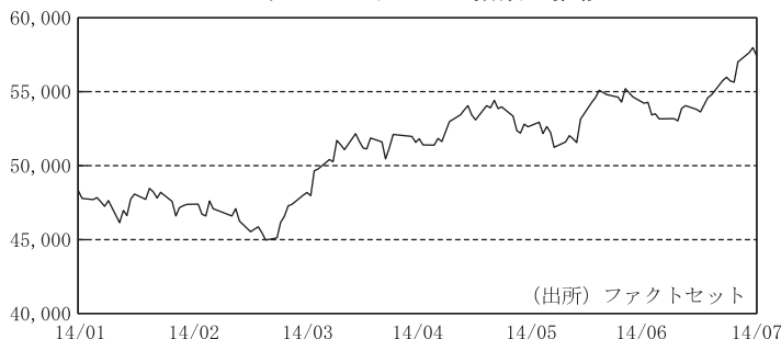
ブラジル・ボベスパ指数の推移

■ 期の後半は、政権交代観測と経済活性化への期待感が、引き続き株式市場を押し上げました。また、ブラジル中央銀行が利上げを休止したことも株価の下支え要因となりました。その後、一時、弱めの経済指標を受けて足元の国内経済の脆弱さが意識されたことや、イラクやウクライナ情勢の緊迫化などから調整が入りましたが、世論調査で現大統領の支持率低下が続くと、株価は再び上値を伸ばしました。