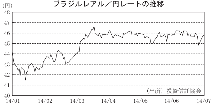
ブラジルリアル／円レートの推移

■ 期の後半は、ブラジル中央銀行が為替介入プログラムの延長を発表し、リアルを下支えする意向を示したことなどから、リアル買いが強まる場面も見られましたが、ウクライナや中東情勢の緊迫化により、投資家のリスク回避姿勢が意識されたことなどから、リアル・円相場は一進一退の展開となりました。