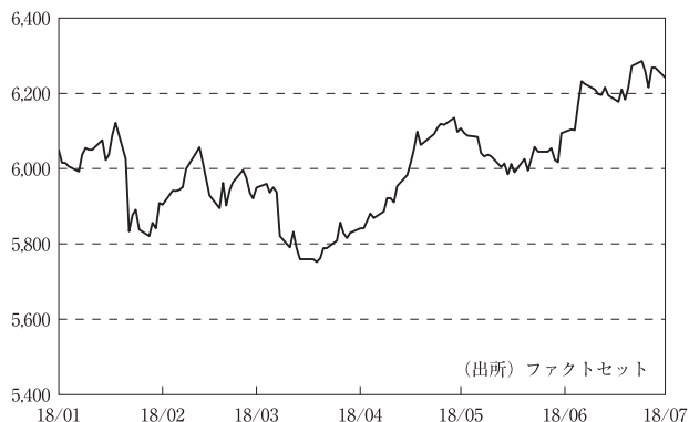
オーストラリア株式指数（ASX200）の推移

期の後半は、2018年1-3月期のGDP成長率が市場予想を上回るなど、国内景気の好調さが好感されたことから、株式市場は強含みとなりました。債券利回りの低下や、不正行為に関する調査を受け低迷していた銀行株が値を戻したことなども、株価を押し上げました。