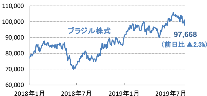
図1: ブラジル株式とリアル相場(対円)の動向

※基準価額算出に用いられる株式価格は、前日の海外市場の終値が適用されます。上記海外市場の株価指数において日本の営業日に応答する海外市場が休日の場合、その前日の指数を提示しています。為替は当日のレートが適用されます。